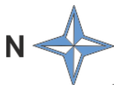
СХЕМА ТРАСИ ЗМАГАННЯ